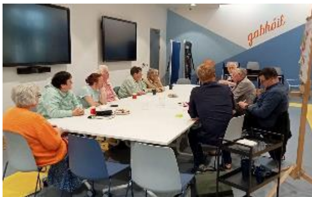
Fíor 6: Seisiún comhairliúcháin le baill de leabharlann Chluain Dolcáin Thuaidh

Dhírigh gach seisiún ar théama difriúil bainteach le gníomhaíocht leabharlainne. Thar gach seisiún dhá uair an chloig, chuaigh grúpa éagsúil rannpháirtithe i mbun cleachtaí plé agus machnaimh saindeartha.