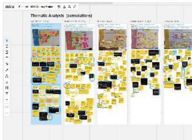
Fíor 7: Mír de bogearra Miro ag déanamh anailíse ar chomhairliúchán

Ar fud an taighde go léir, bailíodh cuid mhór sonraí. Rinne an fhoireann taighde athbhreithniú ar na sonraí seo agus shórtáil siad iad de réir roinnt téamaí. Baineadh úsáid as cur chuige analógach agus anailís dhigiteach araon ag baint úsáide as bogearra comhoibríthe Miro le linn an phróisis. Pléadh téamaí le ceannaireacht SDL agus rinneadh príomhléargais agus dúshláin a chur le chéile agus a scríobh amach.