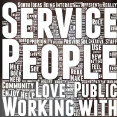
Fíor 4. Néal focal den suirbhé foirne

Tugann sé seo, in éineacht leis an bhfíric go bhfuil foireann na leabharlainne tiomanta do bheith ag obair leis an bpobal agus ag freastal air, le tuiscint go bhfuil foireann Leabharlann Átha Cliath Theas réidh agus toilteanach dul sa bhearna bhaoil agus ról gníomhach a ghlacadh i gcinntiú go n-éireoidh leis an bplean forbartha seo.