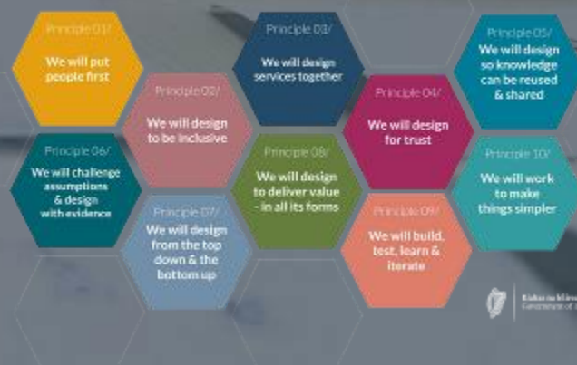
Fíor 5. Prionsabail Dearaidh don Rialtas in Éirinn