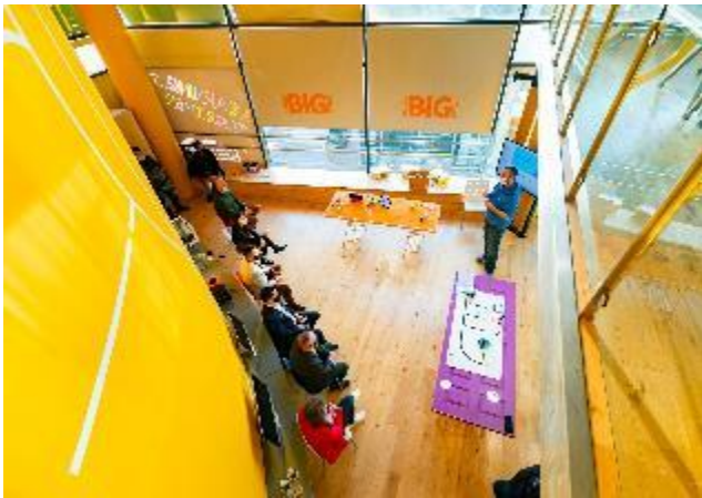
Fíor. 2 Lig le do smaointe

I mí na Samhna 2022, bhronn Chambers Ireland Gradam Sármhaitheasa i Rialtas Áitiúil Think Big Space faoin gcatagóir Nuálaíocht Údaráis Áitiúil.