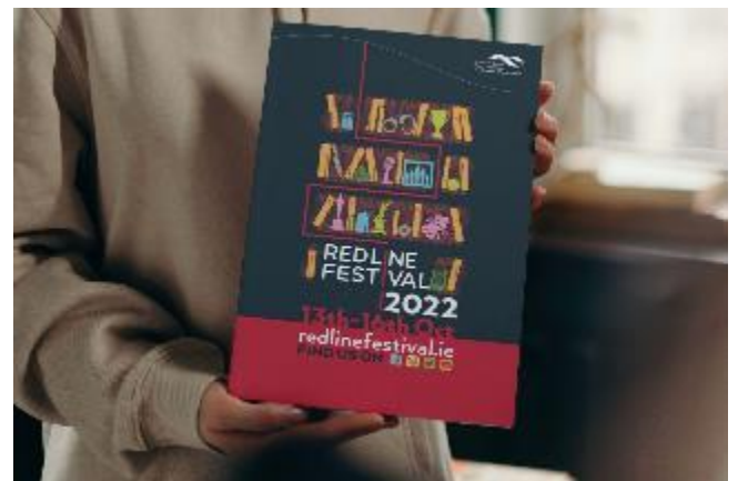
Fíor.3 Clár fhéile na Líne Deirge 2022