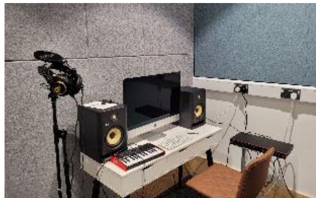
Fíor 1, An Stiúideo Cruthaitheach ag Leabharlann Chluain Dolcáin Thuaidh

Tá raon leathan de threalamh ceoil agus gairis taifeadta againn ar féidir le húsáideoirí an stiúideo ia a úsáid. Is féidir le húsáideoirí a n-uirlisí féin a thabhairt isteach chuig an stiúideo freisin.