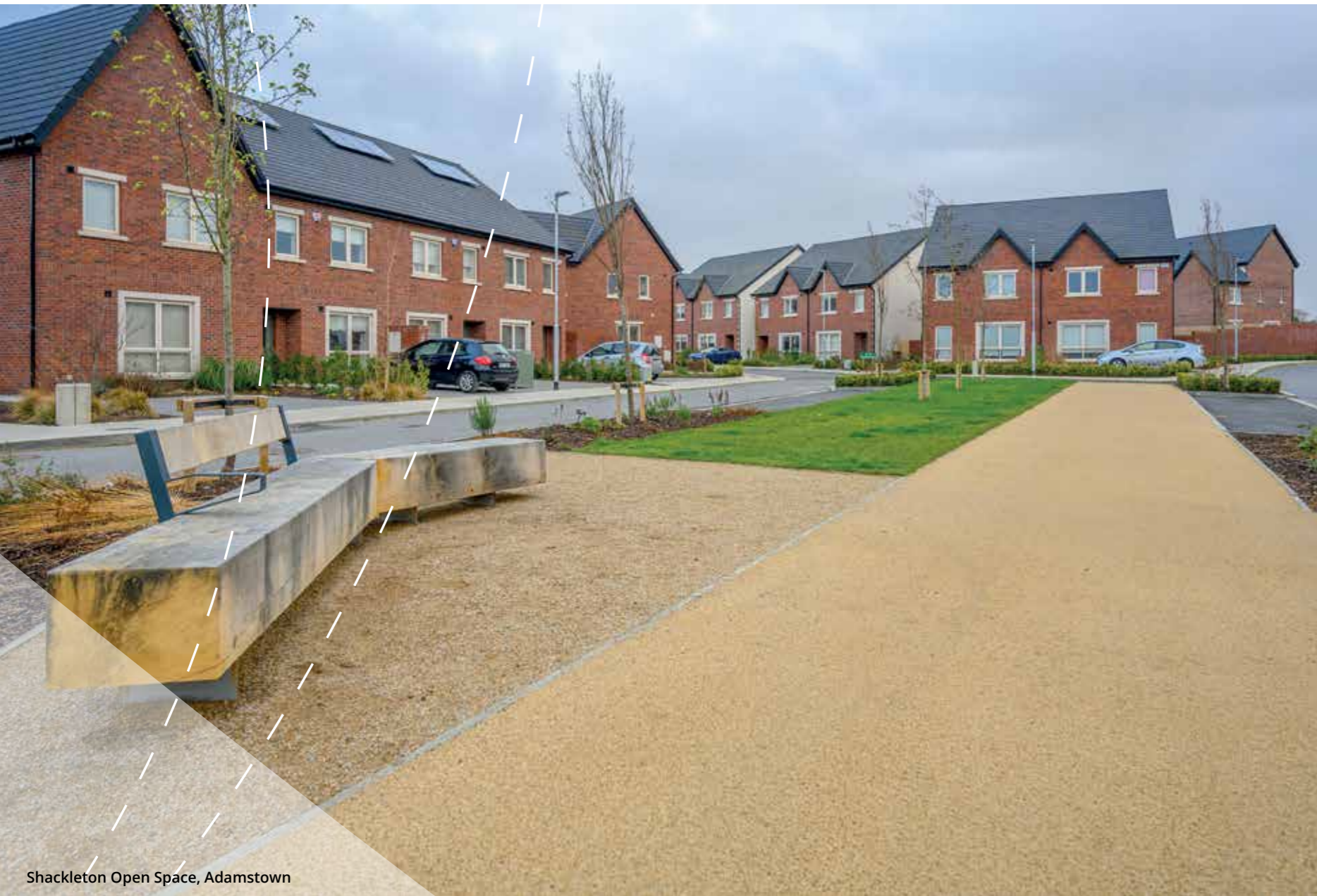
Shackleton Open Space, Adamstown