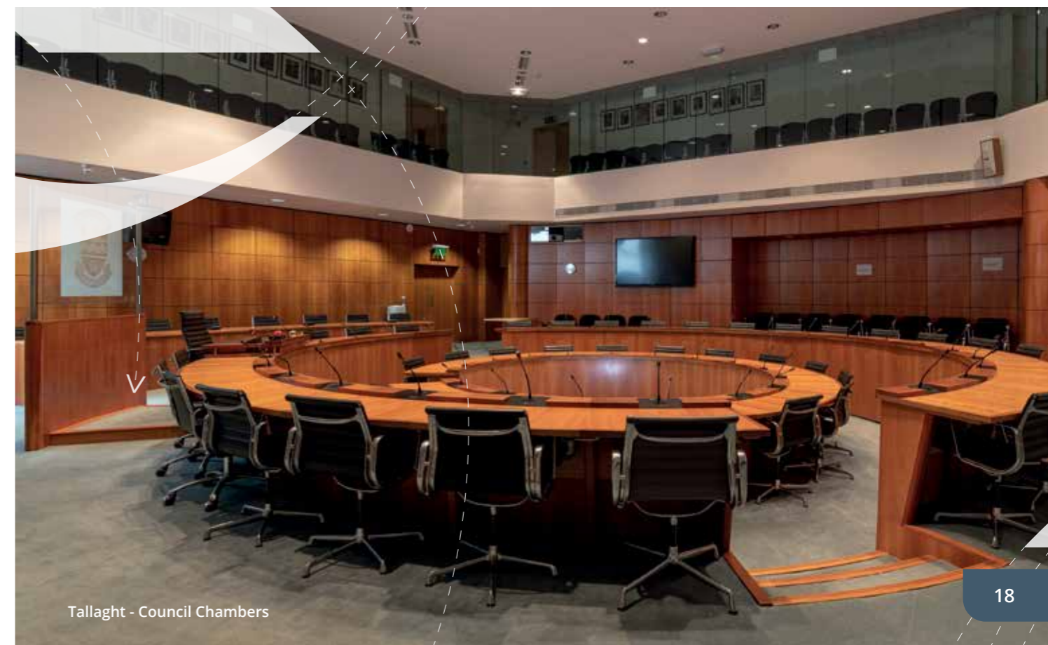
Tallaght - Council Chambers

Beidh tionchar suntasach ag seachadadh Phlean Gníomhaíochta na Comhairle um Athrú Aeráide ar ghníomhaíochta uile na Comhairle le tacú leis na spriocanna athrú aeráide a bhaint amach. Tá