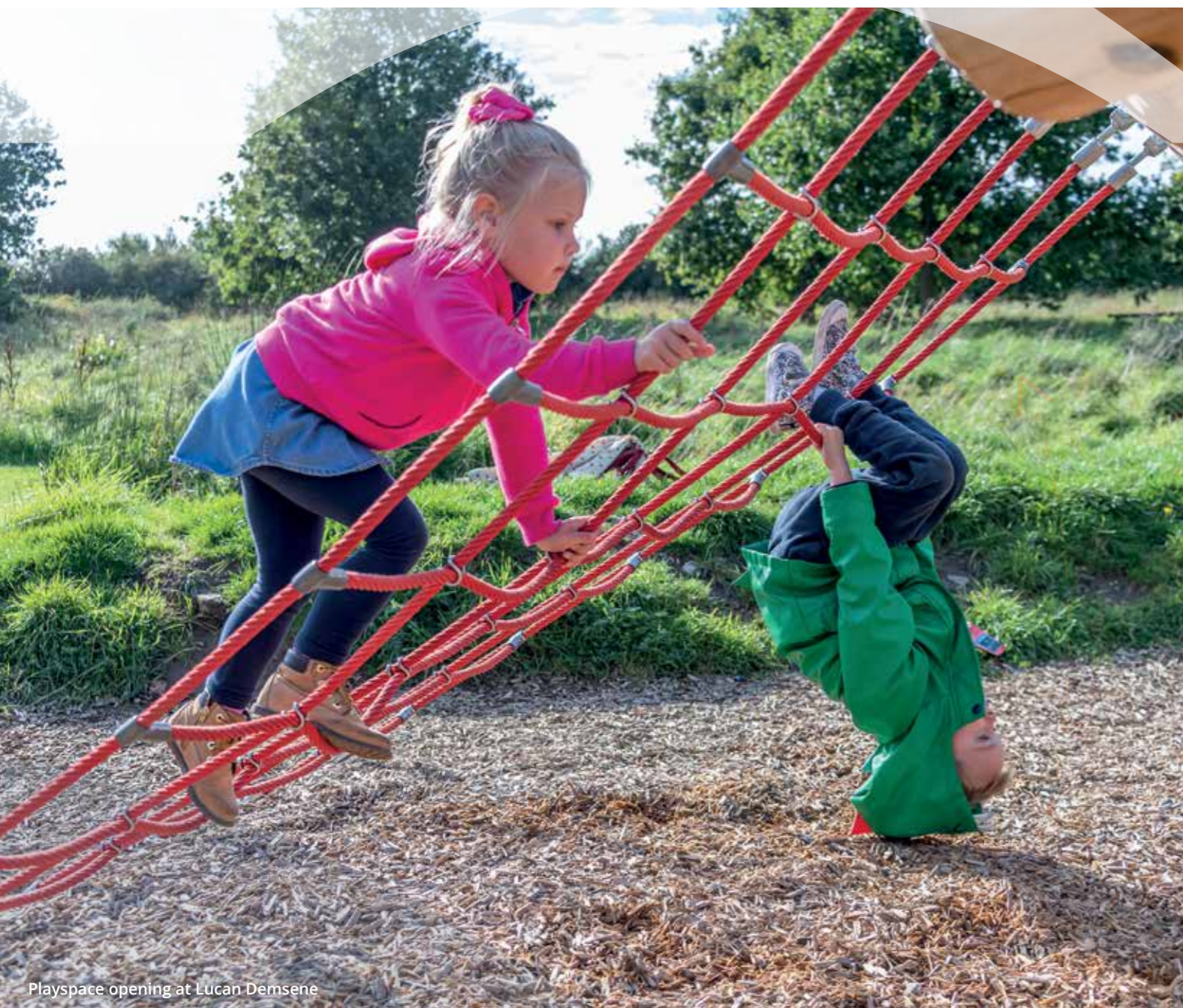
Playspace opening at Lucan Demesne