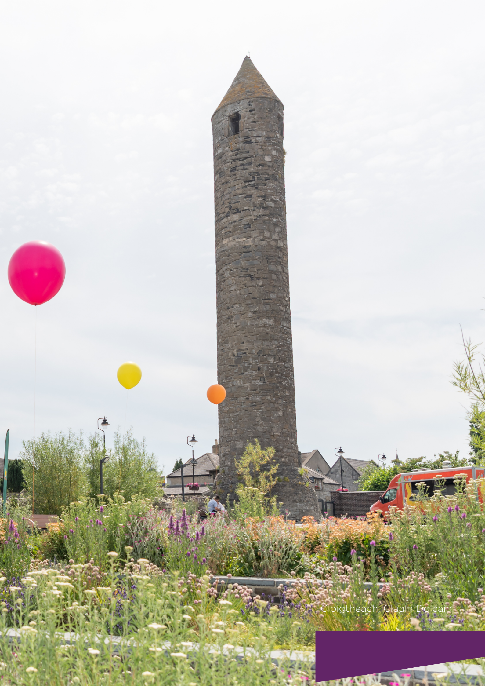
Cloigtheach, Cluain Dolcáin.